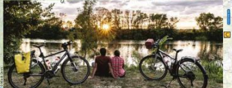
A vivre et partager toute l'année sur un site actif et touristique et les réseaux sociaux #Muscledetourisme